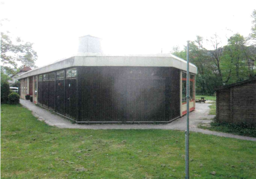
Ansicht vorne rechts