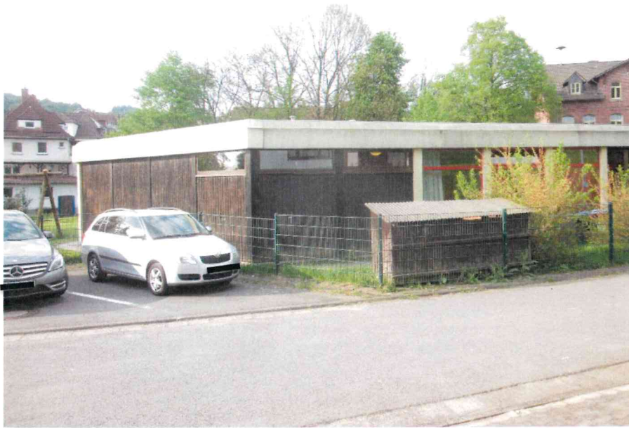
Ansicht vorne links