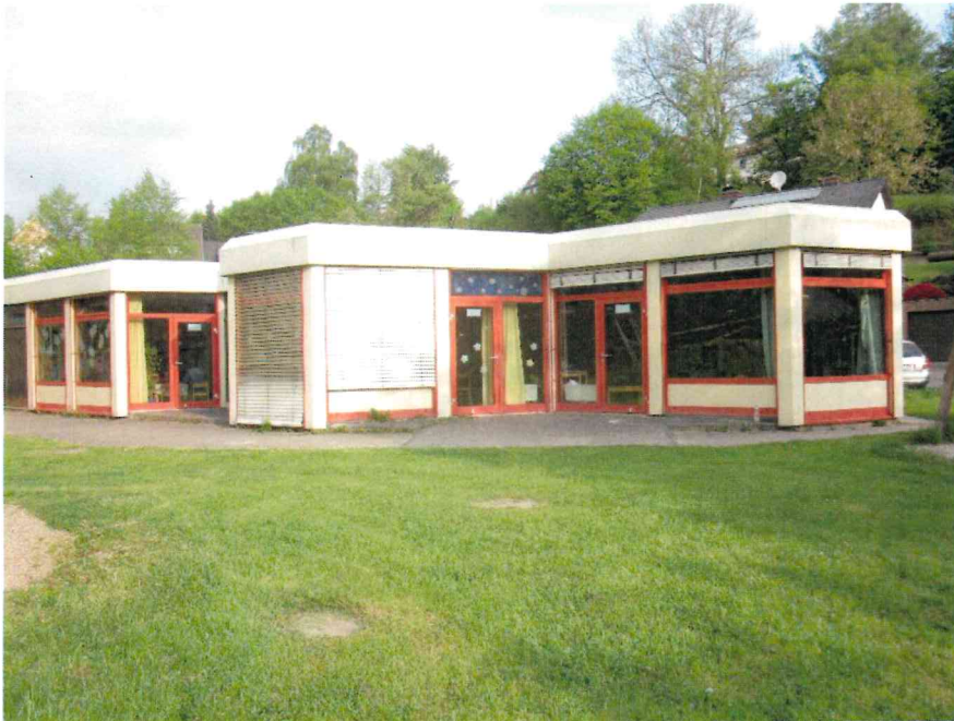
Ansicht hinten links